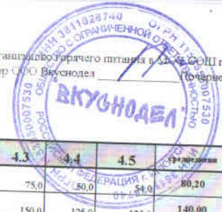
Таблица распределения среднесуточных наборов пищевых продуктов